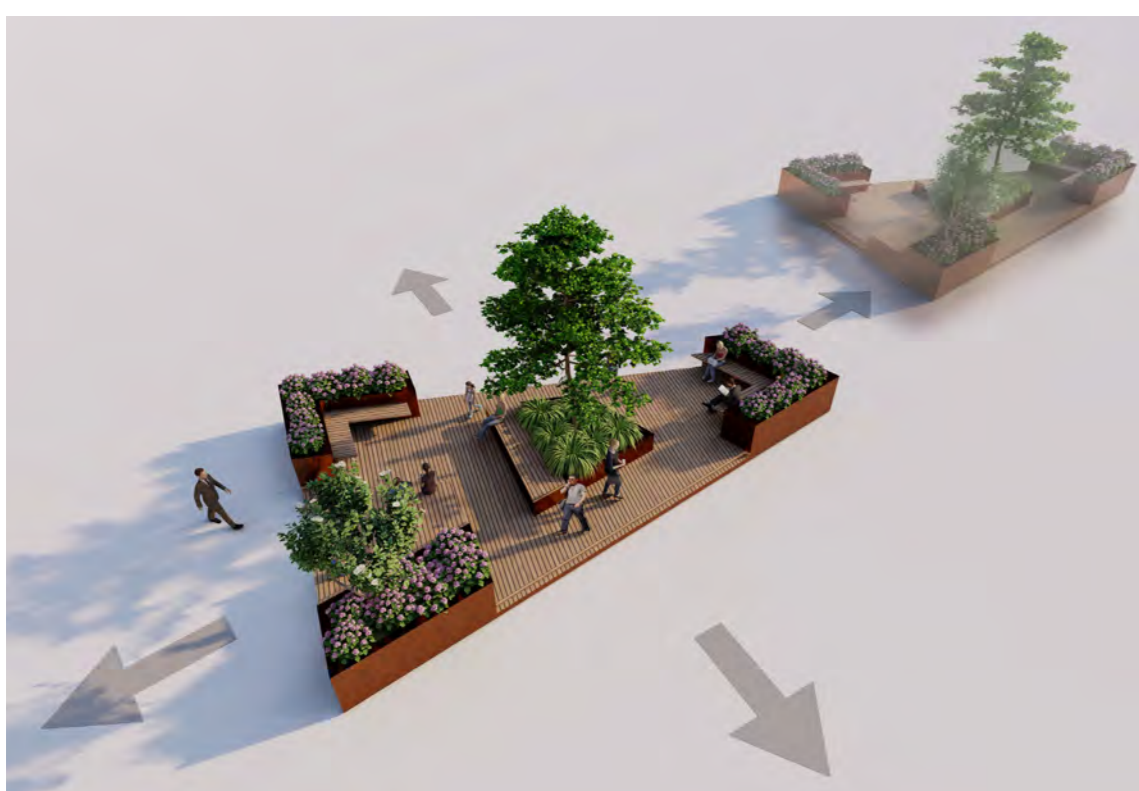
Verschiebbare Sitzinsel inklusive Wassertank

Die neue Gestaltung wurde mit Hinblick auf den jetzigen Aufbau des DOMs entwickelt, sodass von den Schausteller*innen keine Einschränkungen hingenommen werden müssen.