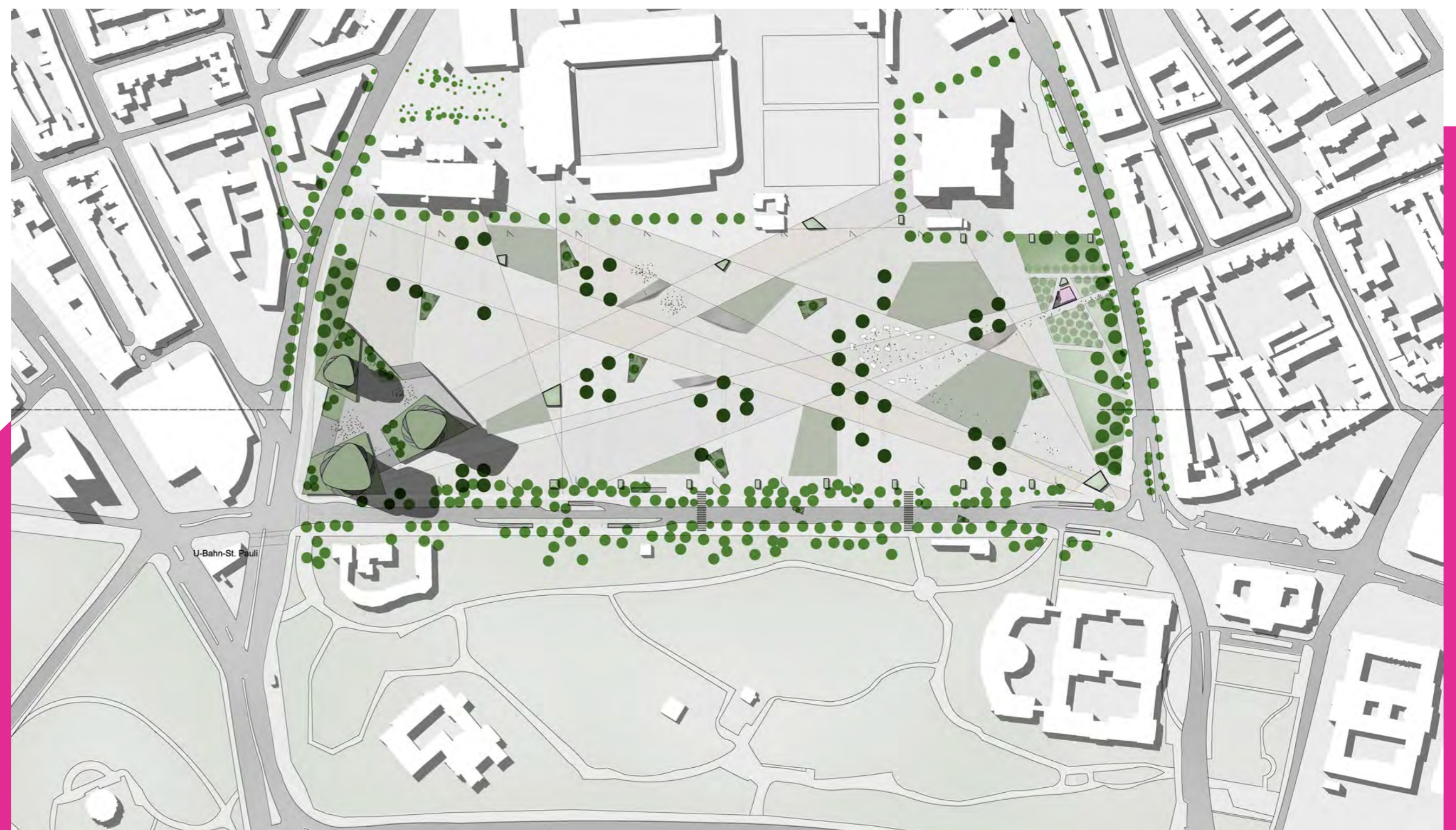
© alle Abbildungen weisschmidt Architekt und FTLD Landschaftsdesign