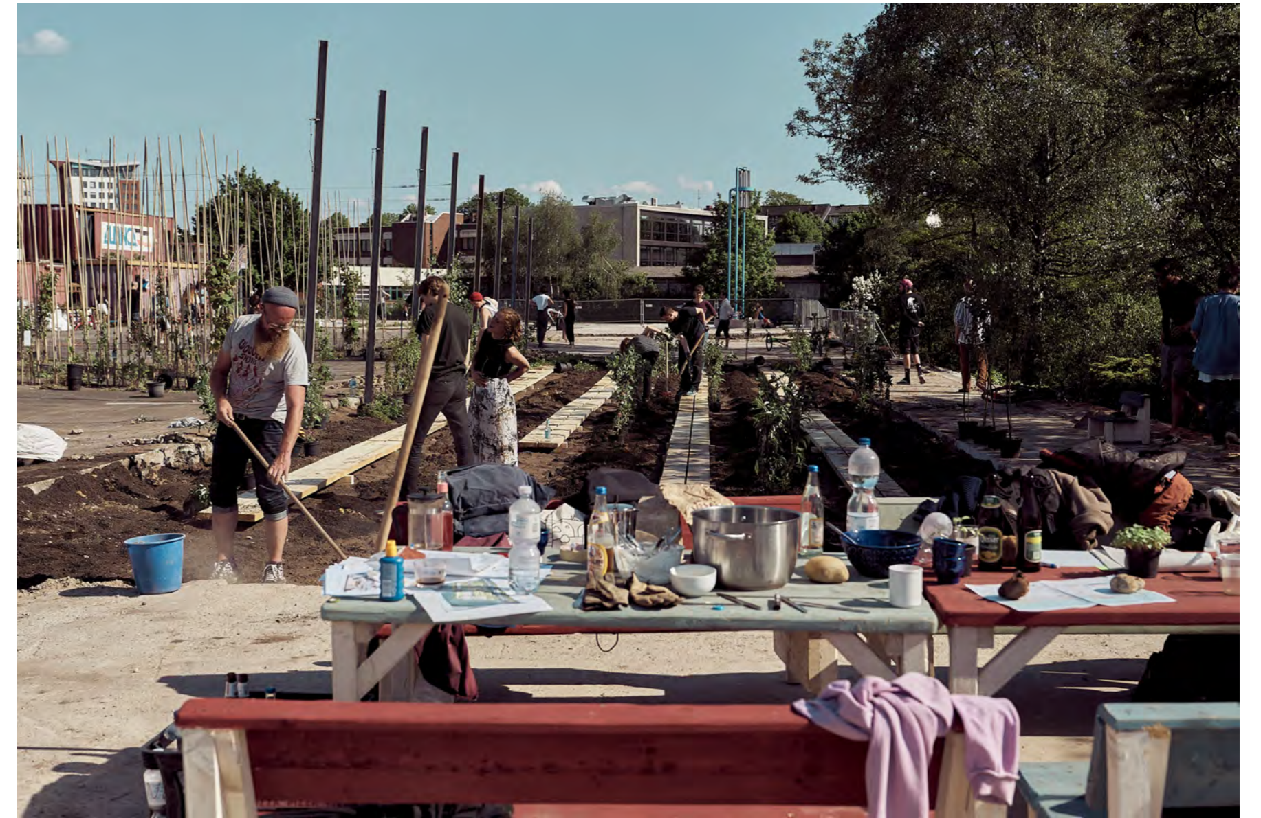
Pionierfeld auf dem Alten Recyclinghof

PARKS kuratiert den Alten Recyclinghof im Sinne des Ermöglichens: Freiräume werden bewusst erhalten, Nutzungsweisen überlagert, Prozesse offengelegt und vermittelt.